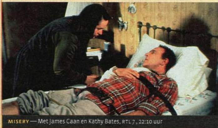
MISERY — Met James Caan en Kathy Bates, RTL 7, 22:10 uur

MISERY (1990, Rob Reiner) Beklemmende thriller over bestseller-auteur (James Caan) die na auto-ongeluk wordt verzorgd door