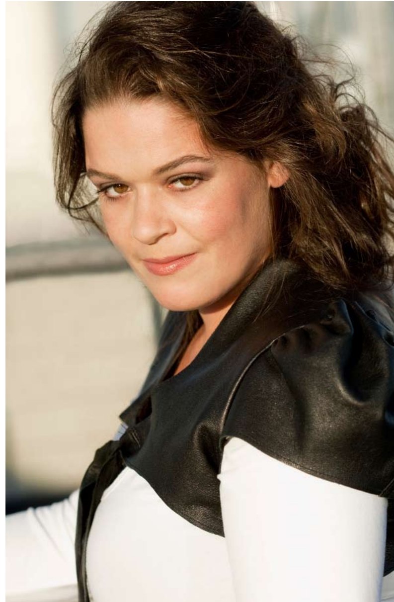
LEREN JASJE (LIONE € 200), WITTE TOP (DE BIJENKORF € 24,95)

Braaf thuis zitten schrijven valt niet mee nu ze verliefd is. “Ik wil bij Bo zijn, maar ik wil ook een goed programma maken. Soms wil ik alleen slapen omdat ik dan de hele nacht kan doorschrijven. Maar ik vind het heel moeilijk om dat aan te geven, want ik ben bang ▶